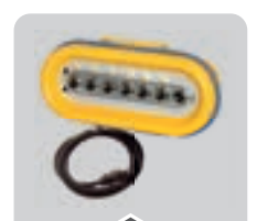
COMPUTER E PANNELLI COMPUTERS AND SPRAYERS CONTROL