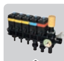
GRUPPI DI COMANDO CONTROL UNITS