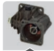
ACCESSORI D'AZIONAMENTO DRIVE ACCESSORIES