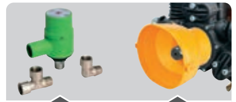
DISPOSITIVI DI SICUREZZA SAFETY ACCESSORIES