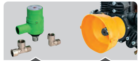
DISPOSITIVI DI SICUREZZA SAFETY ACCESSORIES