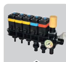
GRUPPI DI COMANDO CONTROL UNITS