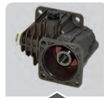
ACCESSORI D'AZIONAMENTO DRIVE ACCESSORIES