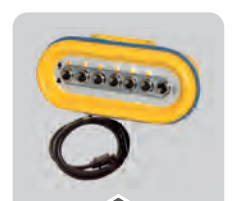
COMPUTER E PANNELLI COMPUTERS AND SPRAYERS CONTROL